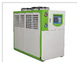
Кулер для воды 冷水机