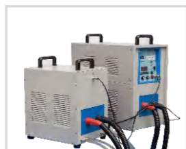
высокочастотная нагревательная машина 高频加热机