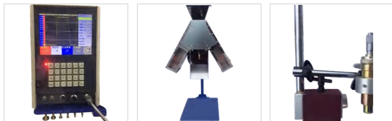
Измеритель длины внешней/внутренней пружины 外置/内置检长系统

6-осевой высокоскоростной станок с ЧПУ для навивки пружин