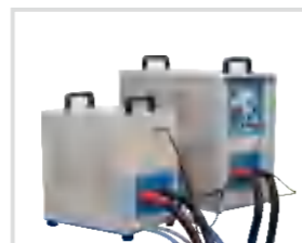
высокочастотная нагревательная машина 高频加热机