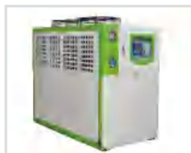
Кулер для воды 冷水机